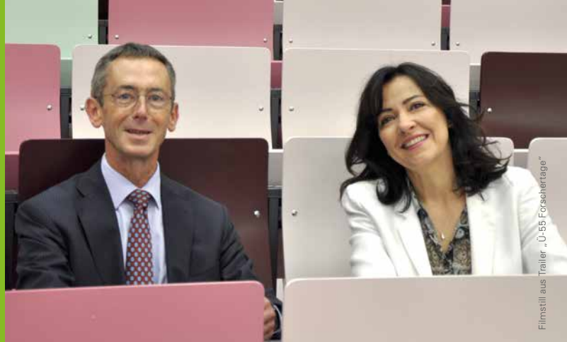
Filmstill aus Trailer „Ü-55-Forschertage“